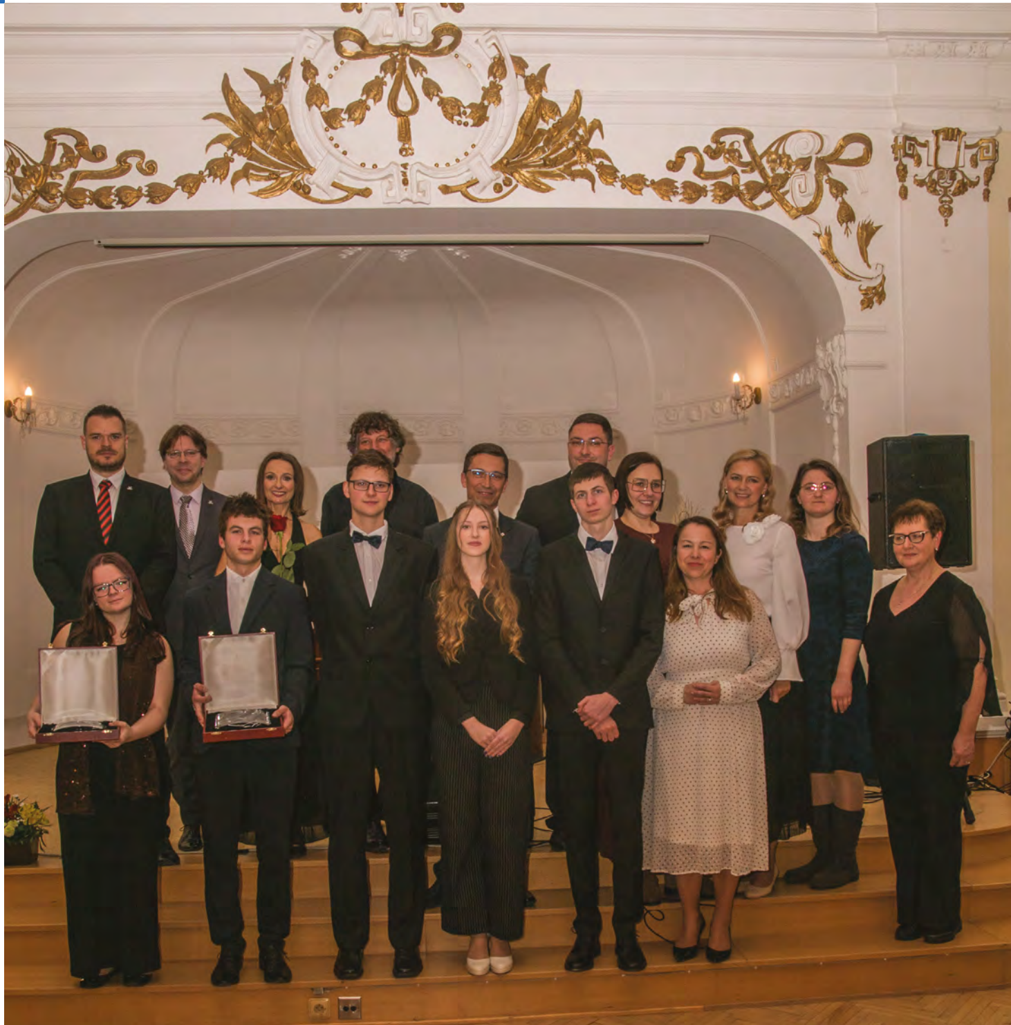
UDÍLENÍ CENY JANA ZAJÍCE