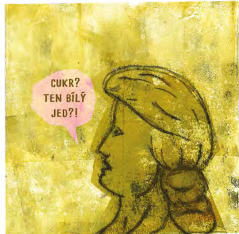
AUTOR RELIÉFU - AKADEMICKÝ SOCHAŘ JIŘÍ MYSZAK