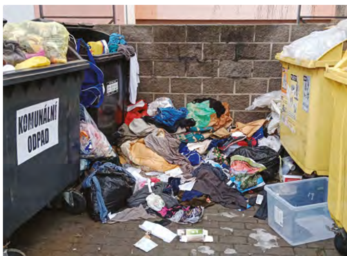
Zátiší ve Wolkerově ulici, sobota 21. února ...