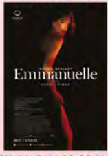
PÁTEK 14. 2. V 19:00 HODIN EMMANUELLE

Před promítáním filmů se bude servírovat šampaňské s jahodami, sladké pusinky. Valentýnský fotokoutek.