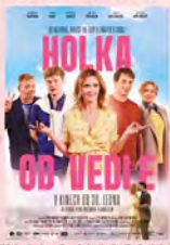
PÁTEK 14. 2. V 16:30 HODIN HOLKA OD VEDLE

Jsi-li sám a nebo v páru, zveme Tě na romantické filmy do našeho sinestáru.